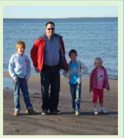
Lekker uitwaaien op het strand