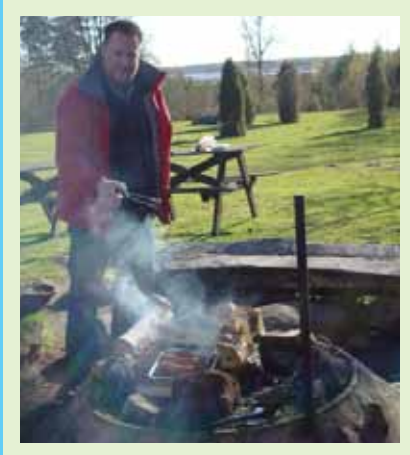
BBQ in natuurpark Store Mosse