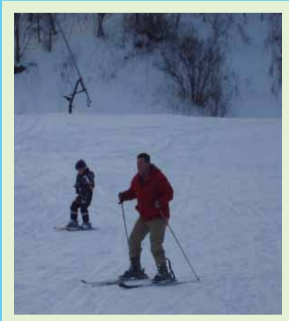
Skieën in Savsjo